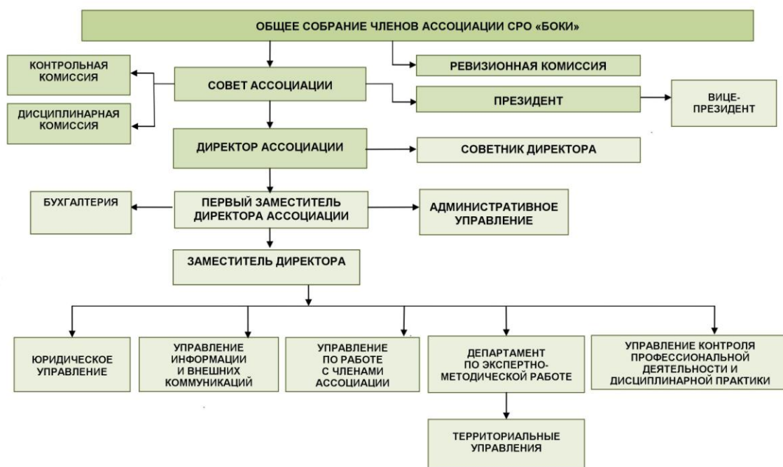
Организационная структура Ассоциации СРО «БОКИ»

В настоящее время Ассоциация объединяет порядка 1600 кадастровых инженеров – как работников юридических лиц, так и индивидуальных предпринимателей в сфере кадастровой деятельности.